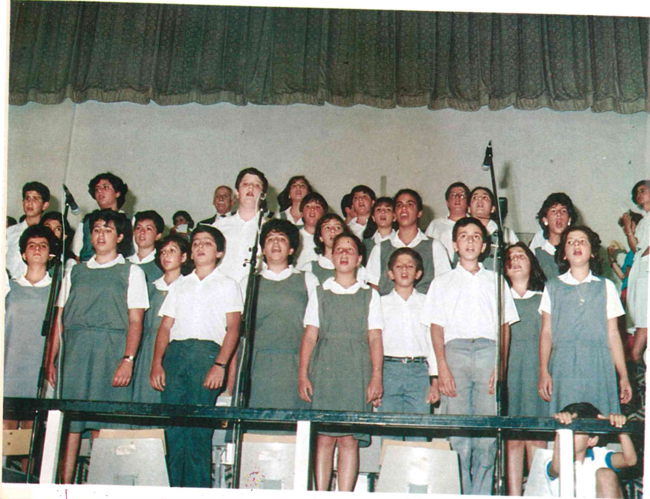
جوقة المدرسة الموسيقية

ثانيا: تعطيل المدرسة في الاعياد الدينية التالية: