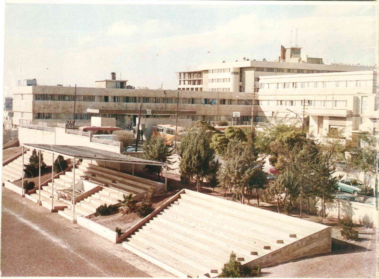
١٩٨٦ / ١٩٨٥