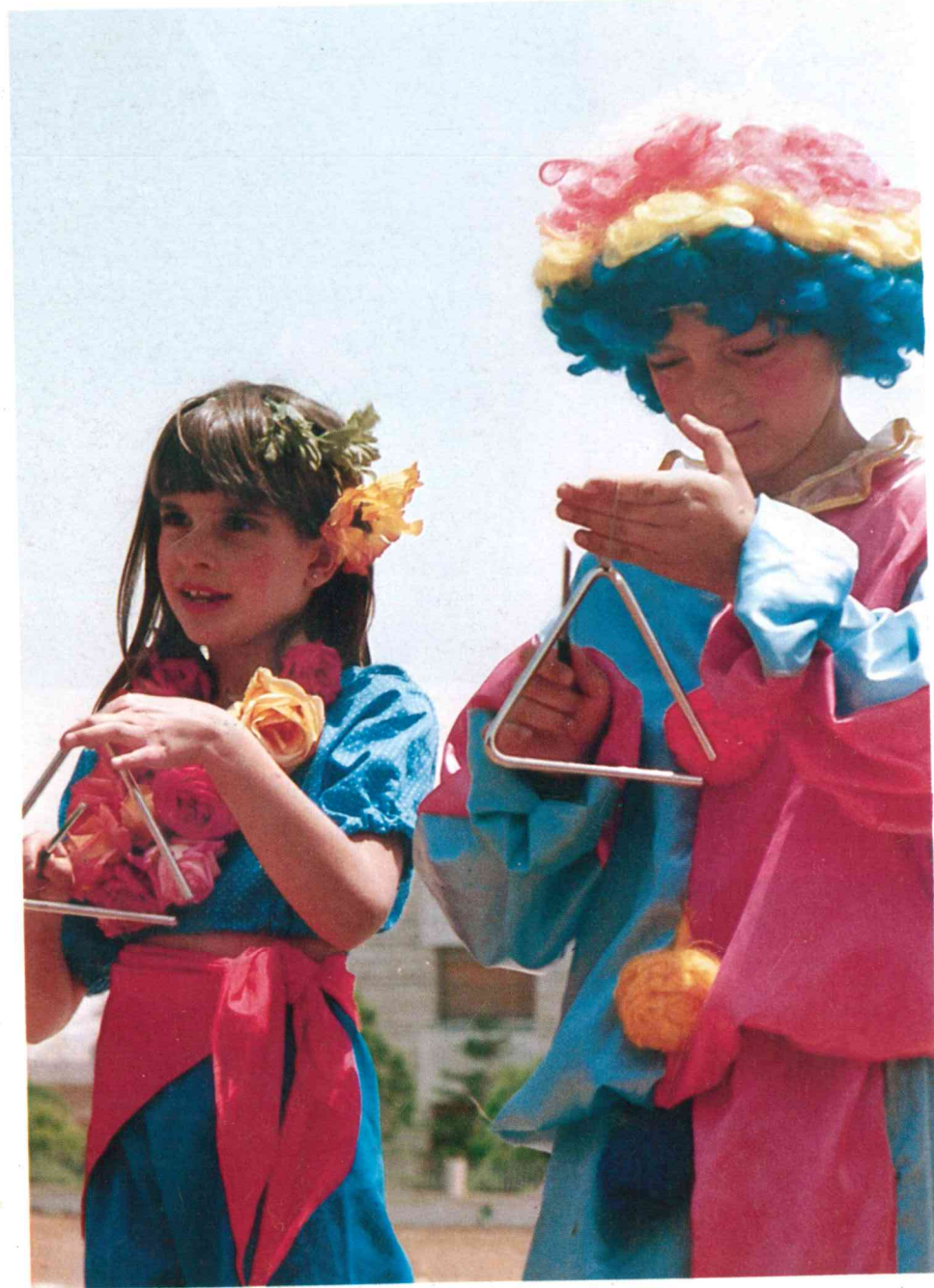
من النشاطات الموسيقية