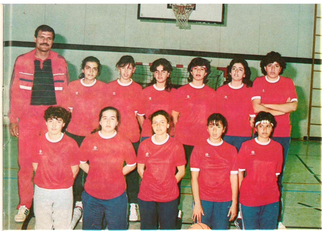
فريق كرة السلة للاناث

وكانت الاشراقه أكبر مما توقع الجميع. فالمستوى العلمي للطلاب مرتفع ونتائج الامتحانات العامة تبشر بعطاء جيد، واعد لهذه الاجيال الفتية النشاطات اللامنهجية (الرياضية والاجتماعية والثقافية والموسيقية والكشفية) التي تنمي المواهب وتقتل الفراغ، وتزيل الاشواك من درب الطويل. وهكذا تمت التجربة بنجاح لتشق لنفسها اسسا محددة في مجتمع يؤمن بالانفتاح والحرية.