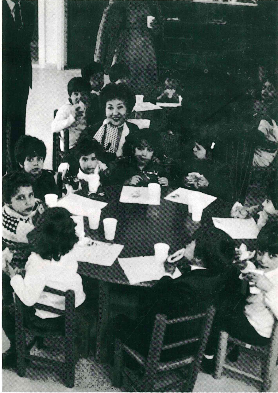
اطفال روضة وهبة تماري

١٤- ظاهرة الدروس الخصوصية في جميع المراحل التعليمية مرض وتقليد، يرجى من أولياء الامور مساعدة ادارة المدرسة في الحد منها، علما بأن تعليمات النظام الداخلي للمدرسة تحظر على المعلم اعطاء طلبته دروسا خصوصية لما تورثه من آثار سيئة على علاقة المتعلم بالمعلم.