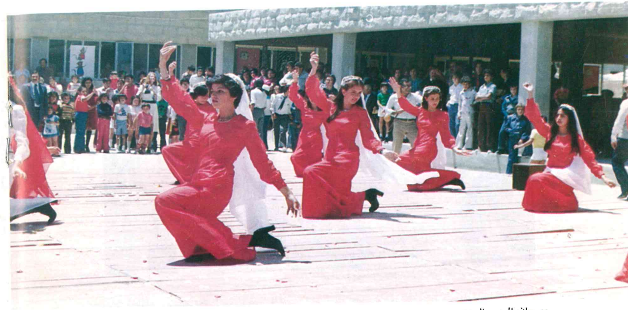
مهرجان الربيع السنوي