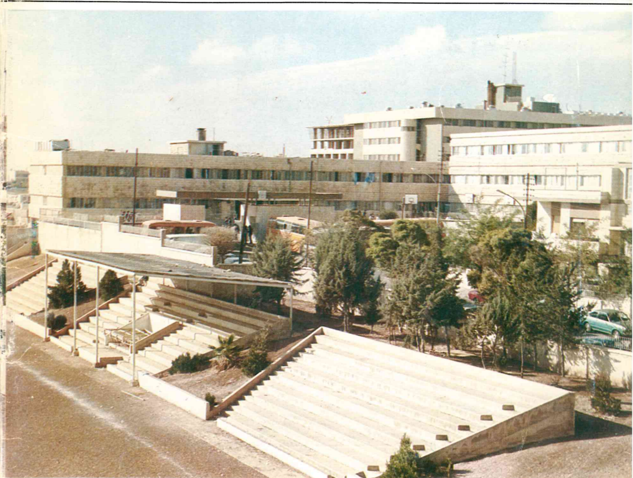
1985 / 1986