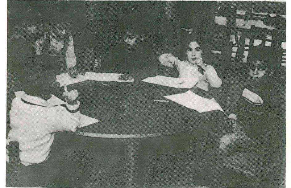
اطفال روضة وهبة تماري

٣- دورة الموسيقى (تعليم بيانو، أورغ، جيتار، درامز، عود) نصف ساعة أسبوعياً. تبدأ الدورة في أوائل شهر تشرين الأول.