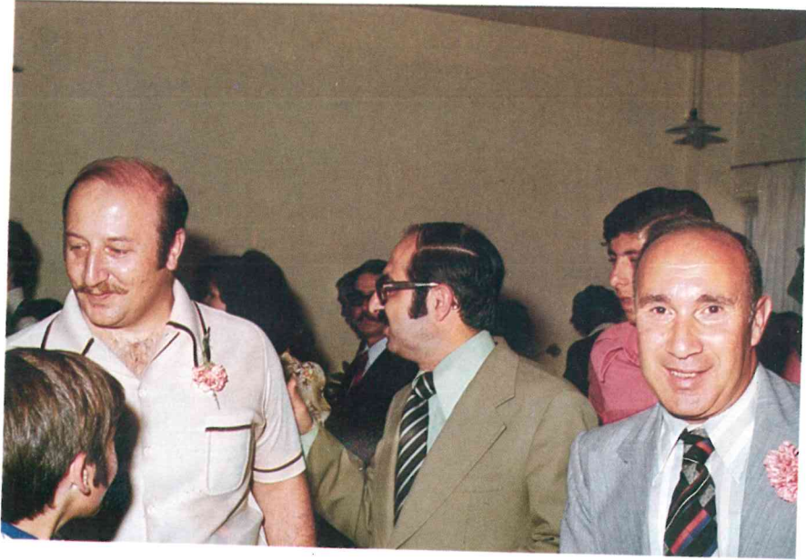
نشاط اجتماعي برعاية دولة السيد زيد الرفاعي